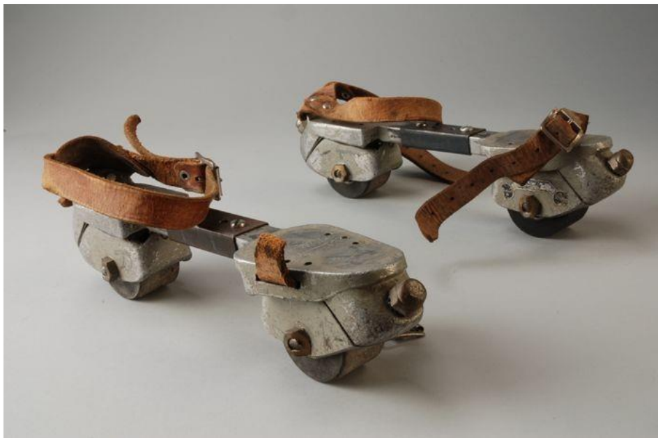
Foto 17. Rolschaatsen, Museum Rotterdam

Deze rolschaatsen kunnen van het type zijn geweest zoals die rond de oorlog te koop waren in het nabijgelegen Voorburg en nu een set zich in de collectie van het Museum Rotterdam bevindt. 28