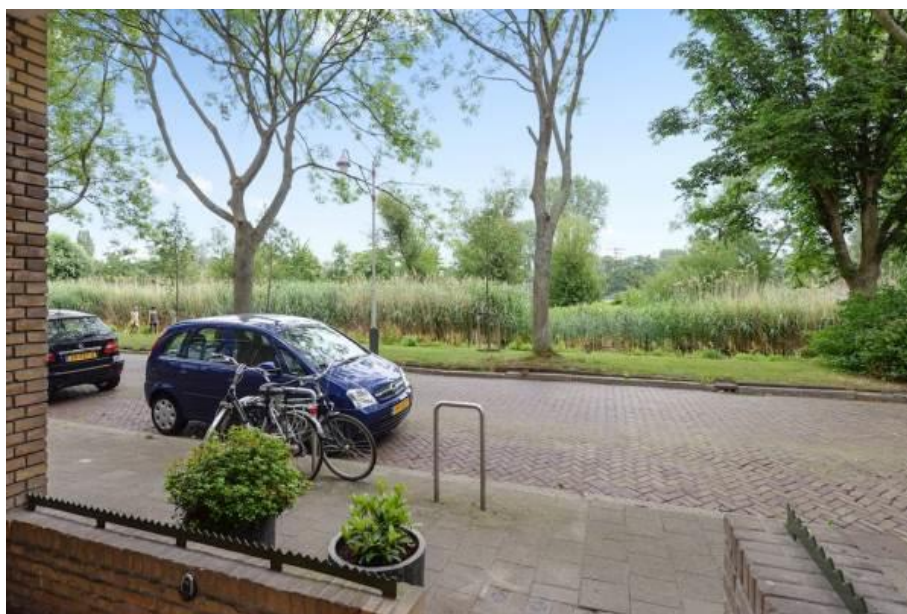
Foto 19. Stoep.