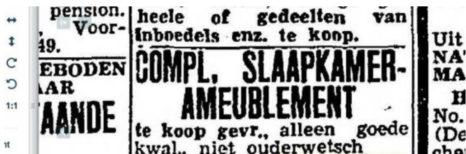
Foto 6. Advertentie Slaapkamerameublement

Bij het bestuderen van microgeschiedenis van een gezin komt de historicus meestal niet achter de deuren van intieme ruimtes als de badkamer of de slaapkamer (behalve dan in onze tijd via de makelaarsite Funda). Toch kwam de deur op een kier van het slaapvertrek op de Carel Reinierszkade door een advertentie die op 26 januari 1943 ook werd afgedrukt in De Tijd. De Vrouw des Huizes vroeg hierin om een “compleet slaapkamerameublement, alleen goede kwaliteit, niet ouderwetsch”. 15