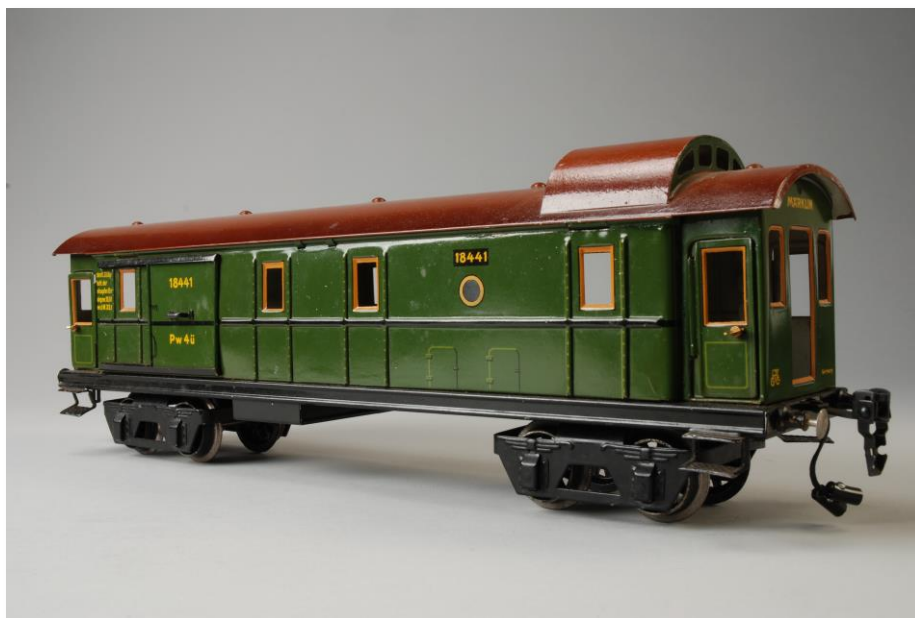
Foto 12. Treintje