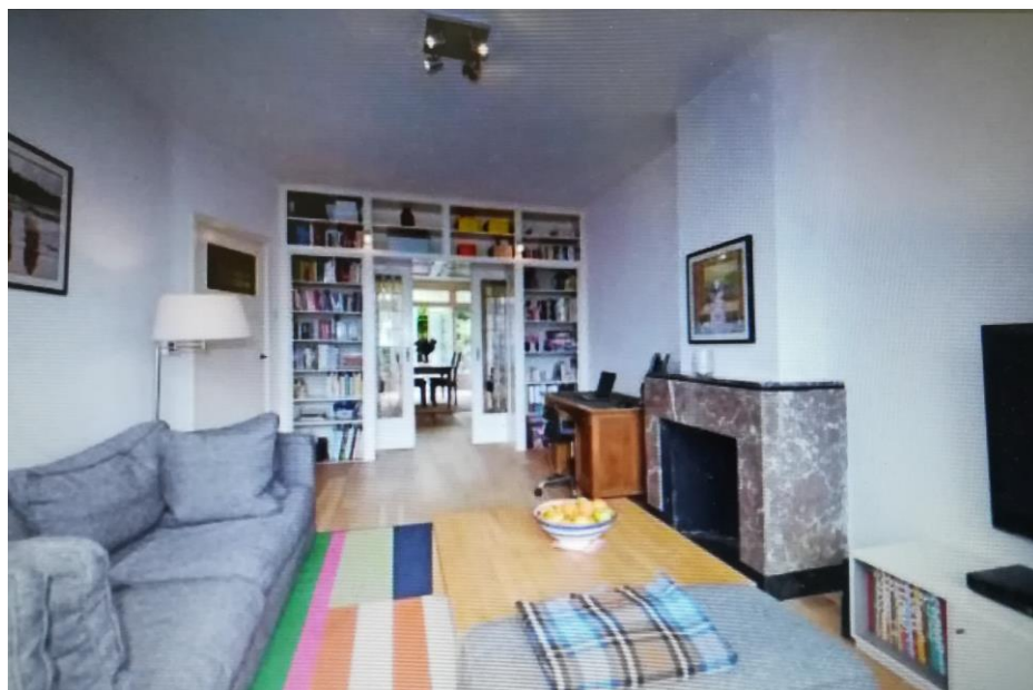
Foto 3. Interieur

Opvallend is dat ook in de inrichting in 2020 ruimte is gemaakt voor een jaren '30 of '40 bureau in de woonkamer, net als dat in de tijd van het Hongaarse gezin het geval zal zijn geweest.