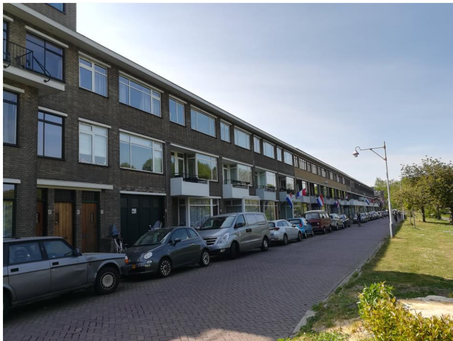
Foto 2. De straat van het huis anno 2020

Het nieuwe adres werd Carel Reinierszkade 257 in de wijk ‘Bezuidenhout’: een Haagse nieuwbouwwijk die tijdens het Interbellum langzaam werd volgebouwd. Het huis keek uit over de weilanden en stond om de hoek van het koninklijk paleis Huis ten Bosch aan de Bezuidenhoutseweg. 9 Op dit adres was ook de onderneming gevestigd, zoals blijkt uit de gedigitaliseerde telefoongids uit 1943. 10 Het is niet duidelijk of het kantoor daarmee ook aan huis werd gehouden. Op basis van de moderne gegevens van een makelaarssite lijkt het een vierkamerwoning te zijn geweest met twee slaapkamers. 11 Uit een advertentie van het (toevallig) recent verkochte appartement krijgen we een goed beeld wat de jaren ’30 sfeer moet zijn geweest van dit huis. 12