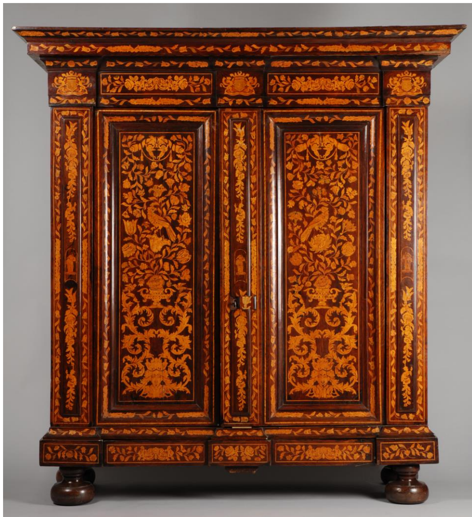
Foto 14. Rankenkast, collectie Museum Rotterdam

Dit meubel moest misschien de pas verworven sociale status van het migrantengezin in het gastland laten zien, maar kan ook de verbondenheid met de Nederlandse cultuur hebben benadrukt. Het was wellicht ook een teken dat deze migranten wisten hoe het hoorde in een net “Hollandsch huisgezin” van goede komaf.