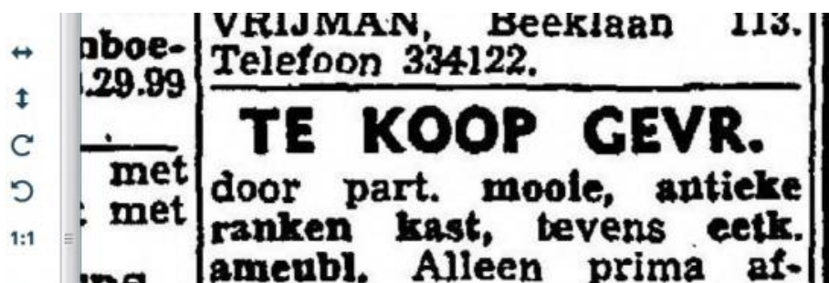
Foto 13. Advertentie rankenkast

De eetkamertafel en stoelen zullen wel een eigentijdse set zijn geweest, misschien opnieuw van het merk Gispen. De keuze voor een antieke rankenkast in de huiskamer is opmerkelijk gezien de moderne smaak van de huisvrouw, zie bijvoorbeeld de rankenkast uit de collectie van Museum Rotterdam. 25