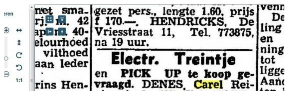
Foto 11. Advertentie treintje en pick up

Misschien wel mede dankzij de comfortabele lits-jumeaux bloeide het gezinsleven in den vreemde. De Hongaarse traditie is dat met Kerst cadeautjes worden uitgewisseld, die in gezinnen met kleine kinderen op Kerstavond door de Hongaarse “Jézuska” (“kleine Jezus” of het Christus-kind) onder de kerstboom worden gelegd. Uit een advertentie die op 29 november 1943 is geplaatst, kunnen we opmaken wat de bedoeling was dat met Kerst 1943 onder de Haagse kerstboom terecht zou komen. 22