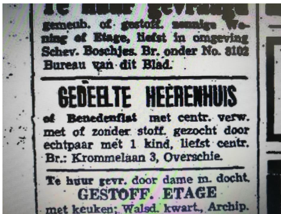
Foto 1. Advertentie

Het desbetreffende gezin was rond 1937 verhuisd van Boedapest in Hongarije naar Rotterdam. De man des huizes was directeur van een Rotterdamse rubberonderneming Interrub, een dochteronderneming van een groot bedrijf in Hongarije. 7 Hij vestigde zich met zijn familie in een rijtjeshuis aan de Krommelaan 3 in Overschie bij Rotterdam en het kantoor van het bedrijf stond in de Rotterdamse binnenstad. Na het bombardement op Rotterdam tijdens de meidagen in 1940 wilde het gezin opnieuw verhuizen en plaatsten ze in september 1940 de volgende advertentie in de krant Het Vaderland. 8