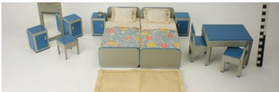
Foto 7. Bed

tijds van vormgeving waren. 17 Hoe een moderne slaapkamer van goede kwaliteit eruit moet hebben gezien kunnen we opmaken uit een poppen slaapkamer uit 1940 afkomstig uit de collectie van het Museum Deventer. 18