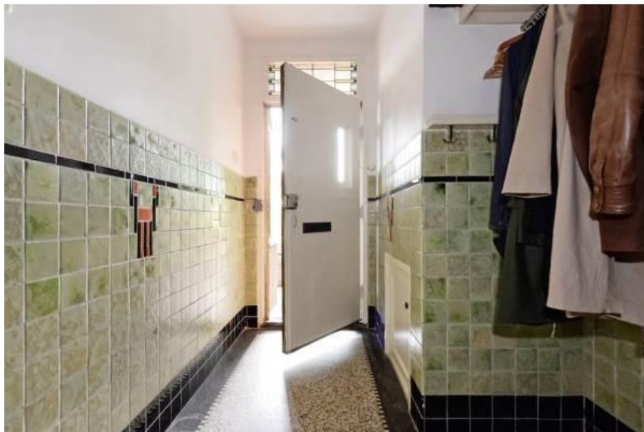
Foto 18. Voordeur