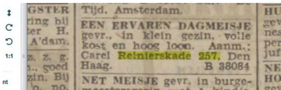
Foto 5. Tweede advertentie

Waarschijnlijk had de oproep geen succes. Daarom verscheen een week later op 23 januari 1943 een nieuwe advertentie, ditmaal in dagblad De Tijd. 14