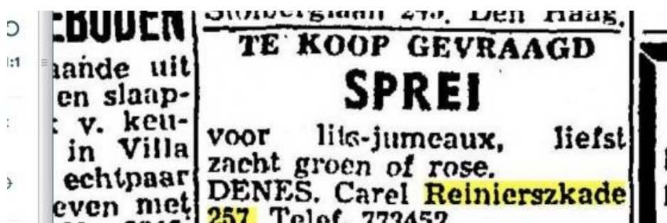
Foto 8. Sprei

Dat de vorige oproep succes had gehad, valt op te maken uit de advertentie die op 25 mei 1943 verscheen in Het Vaderland. 19 De deur van de slaapkamer staat nu echt op een kier, want het gedroomde bed is een moderne lits-jumeaux geworden. De echtgenote is nu op zoek naar een spreij voor dit bed, het liefst in de kleur zacht groen of rose.