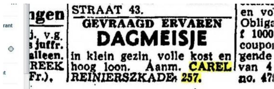
Foto 4. Advertentie dagmeisje

Al vermeldde de advertentie expliciet dat het gezin één kind had, toch kon het huishouden wel wat hulp gebruiken. Op 14 januari 1943 verscheen daarom de volgende oproep in Het Vaderland voor een “ervaren dagmeisje in klein gezin, volle kost en hoog loon”. 13 (Voor een dienstje voor dag- en nacht was geen dienstbodenkamer beschikbaar.)