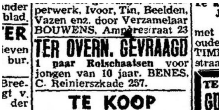
Foto 16. Rolschaatsen gevraagd

Zomer 1944 is waarschijnlijk de laatste rustige en relatief onbezorgde periode voor dit gezin geweest. Na september verschijnen er geen advertenties meer met hun adres of telefoonnummer. Het laatste bericht is een oproep voor een paar rolschaatsen ‘voor een jongen van 10 jaar’. 27