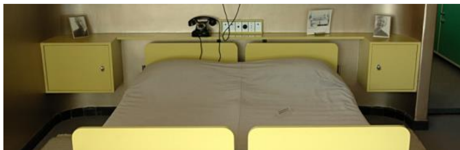
Foto 9. Van Gispen slaapkamer

Een lits-jumeaux bestond uit twee éénpersoonsbedden die naast elkaar stonden. Wikipedia geeft vervolgens een mooi beeld van hoe die slaapkamer op de Carel Reinierszkade er dan uit kan hebben gezien in een uitvoering van Gispen uit 1933. 20