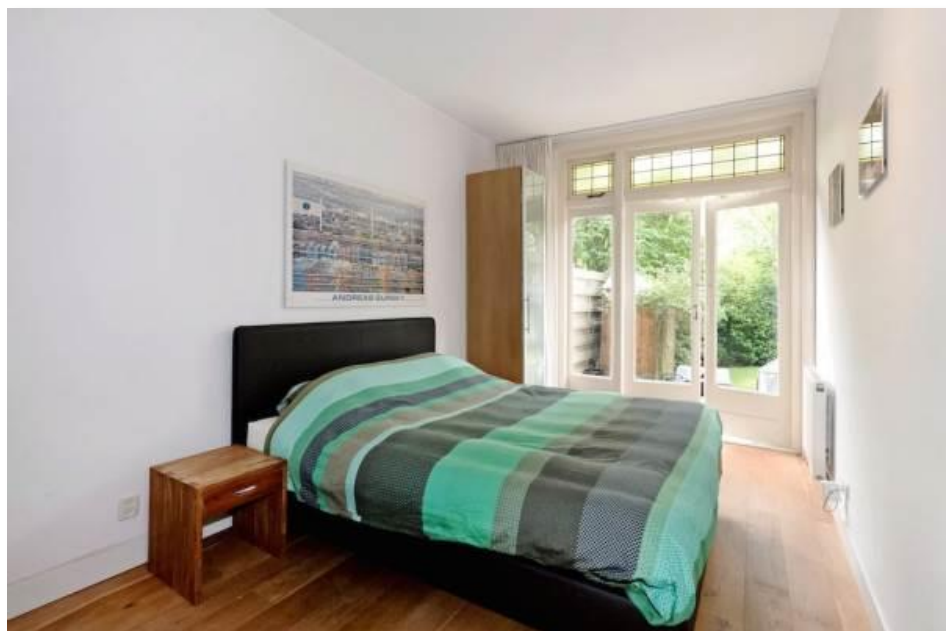
Foto 10. De slaapkamer anno 2020

Dankzij de foto in de moderne makelaarsadvertentie krijgen we ook een beeld hoe die slaapkamer op de begane grond eruit zag. 21