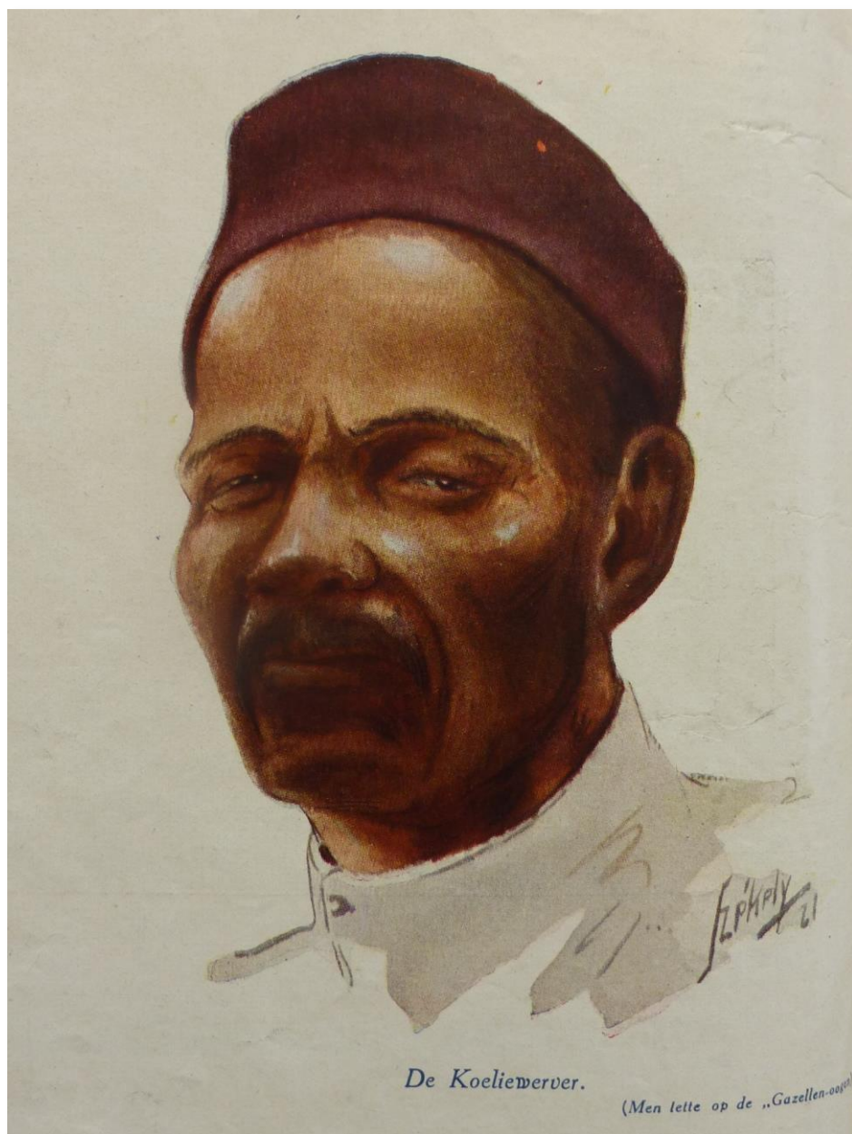
László Székely: De Koeliewerver (1923)