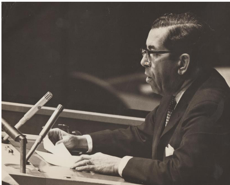
Lou Lichtveld spreekt de Algemene Vergadering van de Verenigde Naties toe, 1 november 1963.

Dat hij naast de schrijverij nog ongelooflijk veel andere domeinen de zijne mocht noemen – het componeren, het vertalen, de journalistiek, de taalkunde, de geschiedschrijving, de filmgeschiedenis, de volkskunde – is uiteengezet in de omvangrijke biografie die in 2016 verscheen onder de veelzeggende titel Rusteloos en overal . Die verschillende domeinen brachten hem in contact met tal van de groten der aarde in de 20 ste eeuw: Béla Bartók, Joris Ivens, George Orwell, Yehudi Menuhin, Frida Kahlo enz. enz. Nog niet genoemd is een domein waarin hij misschien niet zijn allerbeste kwaliteiten heeft tentoongespreid, maar wel enkele van zijn meest opmerkelijke: de politiek en de diplomatie. Dat is tegelijkertijd ook wel een wereld waar je Lou Lichtveld (zoals de burgernaam van Albert Helman luidde) niet zou verwachten. Zijn leven lang heeft hij in krasse statements in teksten en tal van interviews afgegeven op politici, diplomaten en ambtenaren, maar dat weerhield hem er niet van zelf aan het begin van de jaren '60 van de 20 ste eeuw het pad van de diplomatieke carrière te gaan bewandelen. Van alle paradoxale wendingen in het complexe leven van Helman, was deze wel de opmerkelijkste. Die stap was des te opmerkelijker, daar zijn eigen ministerschap van Onderwijs en