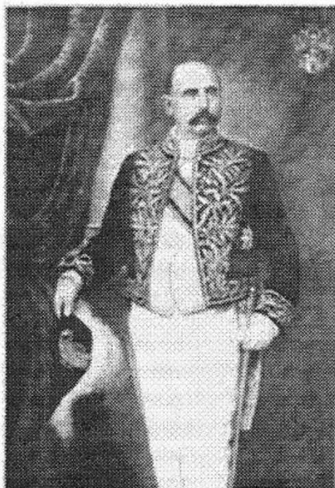
gouverneur-generaal Van Heutsz