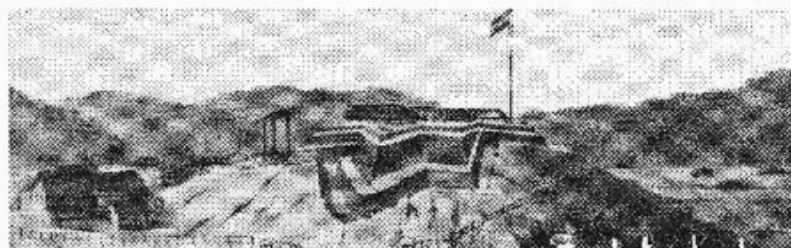
Fort De Kock