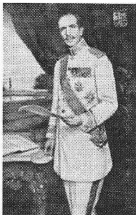
gouverneur-generaal van Limburg Stirum