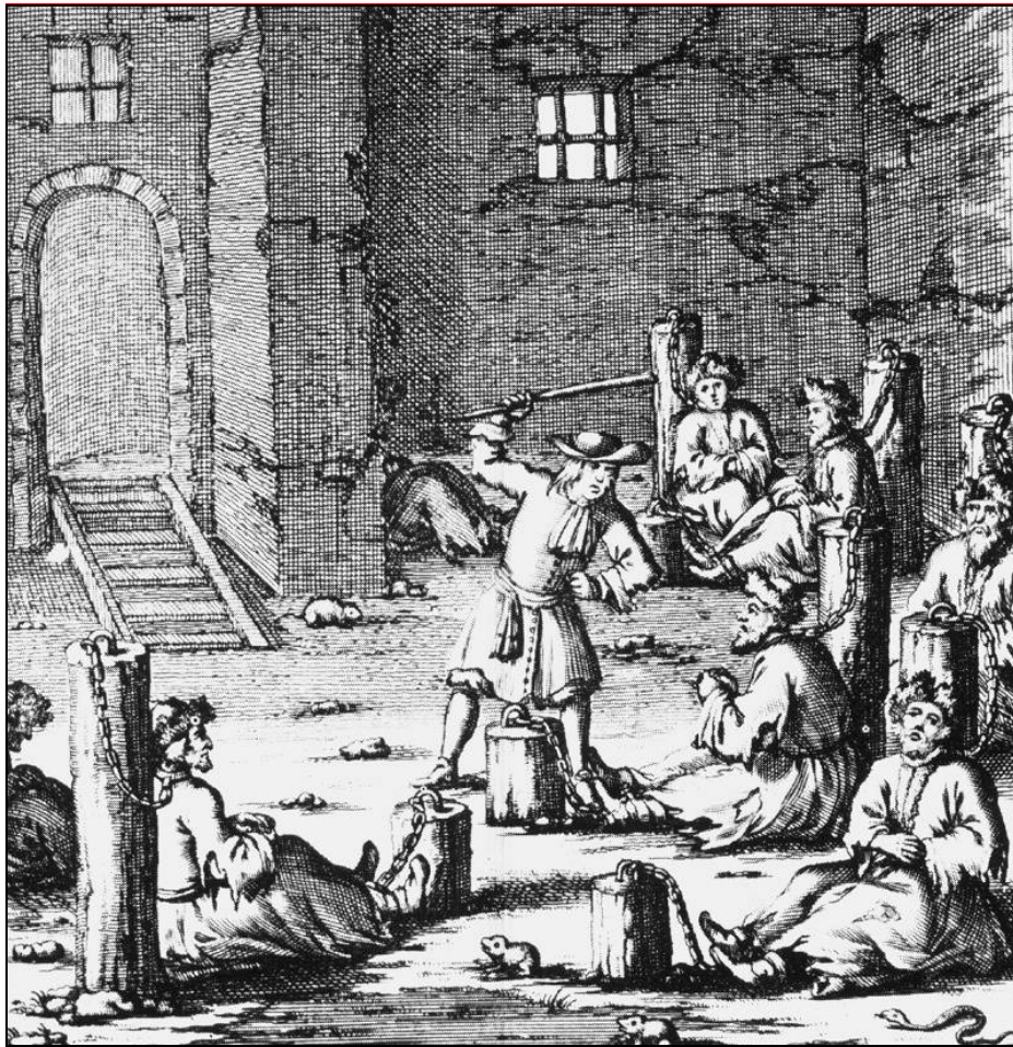
Protestantse predikanten in de gevangenis (Uit het boek van Abraham van Poot)

uitoefenen.) Tijdens die landdag werd de protestantse godsdienstvrijheid beperkt, hoewel de lutheranen en de calvinisten in het oosten van Opper-Hongarije en in het Turkse gedeelte van Hongarije in de meerderheid waren. De Hongaarse adel kon ook daarna niet met de koning in discussie treden over godsdienstkwesties. De geloofstolerantie werd pas later als een onderdeel van de politiek van Jozef II in praktijk gebracht.