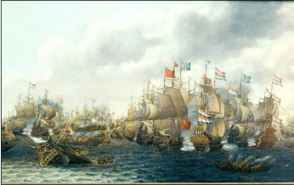
P.C. van Soest: Vierdaagse Zeeslag (Nederlandse Scheepvaartmuseum Amsterdam)

Dit ging gepaard met het feit dat tussen de door de Engelsen ondersteunde handelsmaatschappijen en de Nederlandse West-Indische Compagnie steeds grotere conflicten ontstonden vanwege de rendabele handel in suiker en slaven. Daarom werd in 1663 een nieuwe protectionistische Act of Navigation aanvaard. In de lente van 1664 werden de meeste Nederlandse vestingen aan de West-Afrikaanse kust bezet en in mei van dat jaar volgde de bezetting van Nieuw Amsterdam (nu New York) door de Engelse vloot. Nederland stuurde admiraal Michiel de Ruyter vanuit de Middellandse Zee naar de Afrikaanse kust, waar hij vele bruggenhoofden wist in te nemen. Londen reageerde in januari 1665 met een embargo op de Nederlandse schepen in de Engelse havens. Hiermee begon de jure de Tweede Engelse Oorlog (1665-1667). Engeland leed meerdere nederlagen op zee, de Nederlanders voeren de monding van de Theems binnen en vernietigden een aantal belangrijke oorlogsschepen. Londen werd in 1666 getroffen door een rampzalige brand die de staatskas enorm belastte, maar ook Nederland leed nederlagen. De machtsverhoudingen bleven in evenwicht, geen van de partijen kon de andere verslaan. Frankrijk maakte een einde aan de gevechten, toen het zich in 1667 op zijn erfenis beriep en de Zuidelijke Nederlanden en de Franche Comte aanviel. 31 De Franse expansie verontrustte zowel Londen als Den Haag. De Amsterdamse scheepsei-