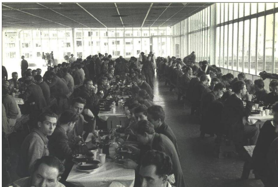
Hongaarse vluchtelingen in de Julianahal te Utrecht

Dankzij het efficiënte coördinatiewerk van het Nederlandse Universitair Asylfonds (UAF) verliep de huisvesting en de voortzetting van de studies van de studenten of potentiële studenten soepel. Het vooruitzicht van de arbeidersjongeren was niet zo positief. Het overgrote deel van de vluchtelingen bestond uit jonge (uit de leeftijd van 16–24) geschoolde en ongeschoolde fabrieksarbeiders en boerenjongens.