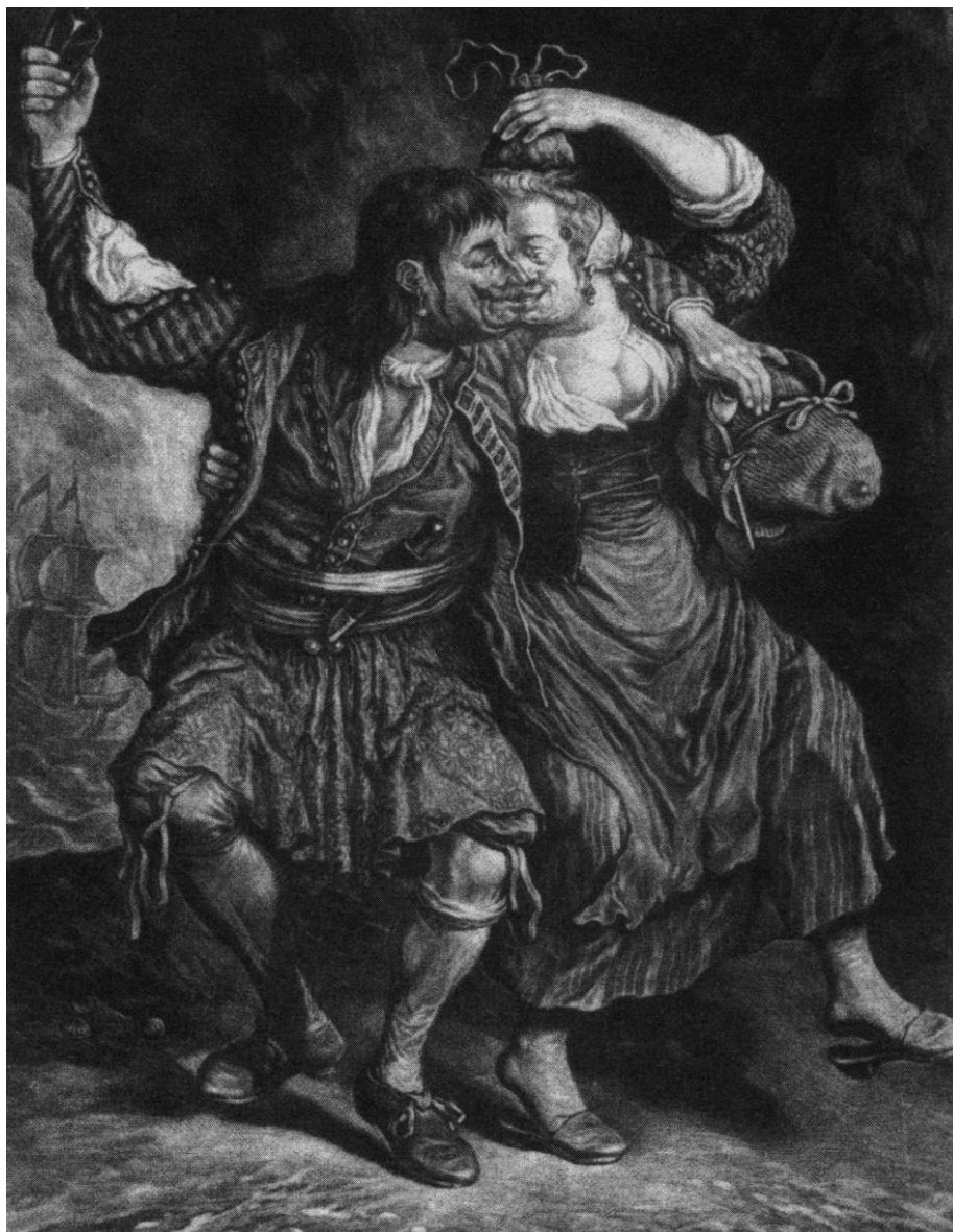
Een afgemonsterde VOC-matros die zijn gage had gekregen werd een "koning van zes weken" genoemd. Als het geld op was, monsterden de meesten weer aan.