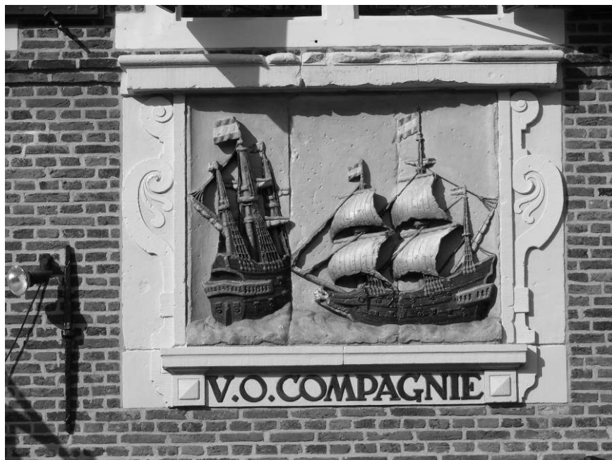
Afbeelding van een VOC-schip aan de muur van een huis in Hoorn

Dankzij de gedetailleerde en goed bewaard gebleven personeelsadministratie is het VOC-archief een unieke en rijke bron van historisch materiaal over de achtergrond van haar personeel. 23 Deze gegevens zijn bewaard gebleven in de scheepssoldijboeken. Een lijst van opvarenden werd opgesteld voor elk VOC-schip dat tussen 1700 en 1795 vertrok naar het oosten, in totaal 4500 schepen. Per werknemer, of het nu een matroos, soldaat of ander bemanningslid was, noteerde de VOC een uitgebreide salarisberekening. Behalve de naam, de plaats van herkomst, de datum van indiensttreding, rang of functie bij indiensttreding, de berekening van het salaris, de vestiging van de VOC waar de opvarende formeel in dienst was (de zogeheten “kamer” van de steden Amsterdam, Delft, Rotterdam, Hoorn, Enkhuizen of de provincie Zeeland), is ook de naam, de datum van vertrek en aankomst van het schip bewaard gebleven. Tot slot kan een aantekening worden gevonden van de datum, plaats en reden van uitdiensttreding, bijvoorbeeld overlijden of “drossen” (zonder toestemming van het schip vertrekken).