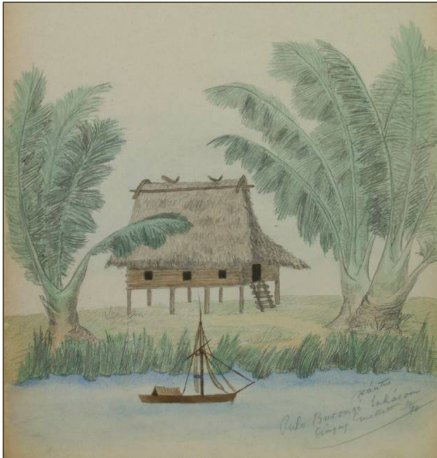
Het huis van János Xántus op Borneo.

Xántus keerde met een rijke verzameling terug naar Hongarije. Na een zware ziekte overleed hij in 1894 in Boedapest. Over het verblijf van Xántus op Borneo schrijft in dit nummer Balázs Venkovits.