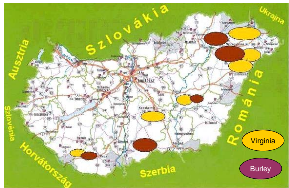
2. ábra: A magyarországi dohánytermesztési térségek elhelyezkedése

A 2. ábrán a dohánytermesztő körzetek jelenlegi alakulását láthatjuk. A világos területek a Virginia típusú dohányok, míg a sötét a Burley dohányok termesztési térségeit szimbolizálja.