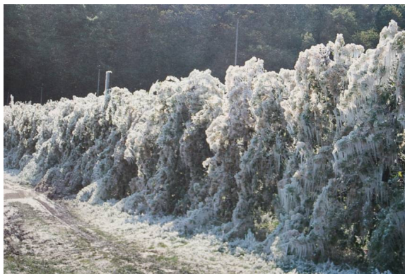
8. ábra: Hatékony védelem a tavaszi fagyok ellen és a vegetációs időszakban