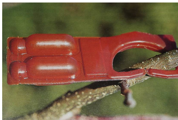
Figure 7: Larger amounts of pheromone capsules can offer complete protection against pests