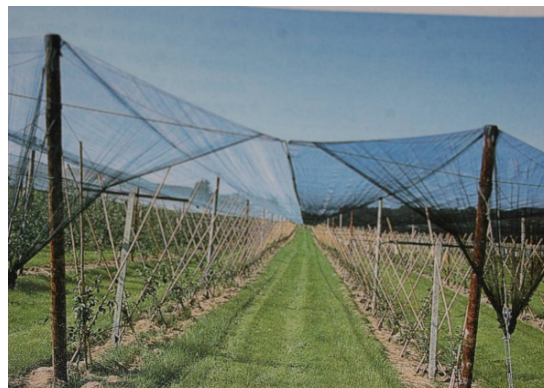
Figure 8: Effective protection against spring frost and in the vegetation period