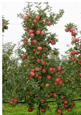
Figure 3: Production can not succeed in extensive grown big trees