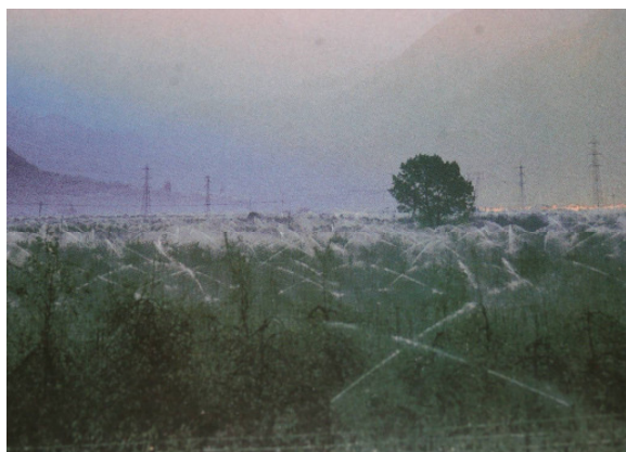
Figure 5: Irrigation