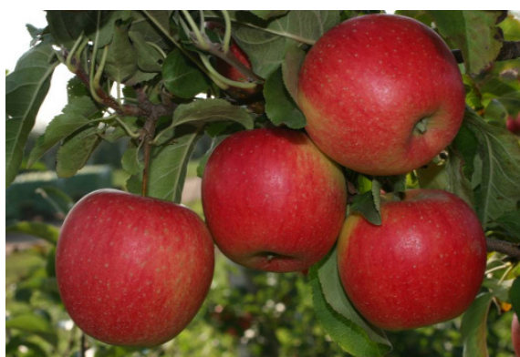
Figure 4: Substantial fruit thinning: better fruit quality and stronger tree fitness