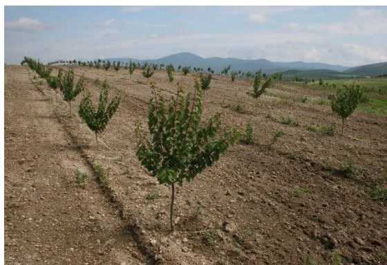
Figure 1: The advantage of production area