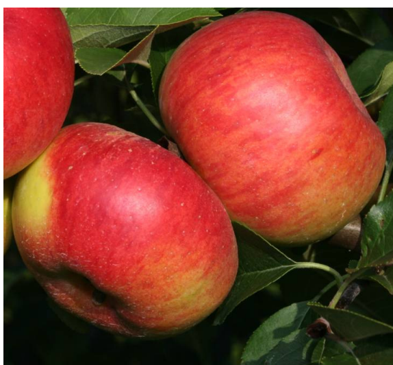
2. ábra: A Topaz és a Releika fajták alkalmasak ökológiai termesztésre

Általánosnak tekinthető követelmény a fajtákkal szemben, hogy nagy termékenységgel és ezzel párhuzamosan kicsi alternancia hajlamuk legyen. Az évről évre kiegyenlített terméshozás ebben a gazdálkodási formában alapvető, ugyanis egy terméssel túlterhelt év után akár több évig is komoly termés kieséssel számolhatunk. Lehetőségünk van olyan fajták alkalmazására, amelyek rezisztensek, vagy toleránsak a leggyakoribb betegségekre, károsítókra (Soltész, 1997b; Holb, 2000a, b). A termesztett fajta növekedési tulajdonságait is szem előtt kell tartanunk, hiszen kedvezőbb egy laza szerkezetű koronát metszeni, permetezni, szüretelni stb., mint egy felfelé törő habitusút (2. ábra).