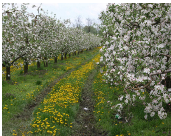
6. ábra: A gyepes sorköz és a talajtakarás gazdagabb talajéletet jelent