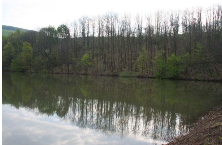
Figure 1: The damage of the Cryphonectria parasitica (Murr.) Barr near Bobovyshe (in Ukraine) Cryphonectria parasitica (1), damage (2), Ukraine (3),

A gomba megfertőzheti a Bükkfélék családjába tartozó más fafajokat is, többek között a tölgyeket és a bükköt is. Ezt igazolja, hogy 1998-ban a betegséget Zengővárkony térségében megtalálták kocsánytalan tölgyfákon is. A tölgyfajok fogékonysága a kórokozóval szemben az eddigi ismereteinek alapján mérsékeltebbnek mondható az európai szelídgesztenyéhez képest. Fertőzést jelenleg elsősorban fiatal tölgyfákon, és általában fertőzött szelídgesztenyések közvetlen környezetében jelentkezik, de a gomba kártétele a jövőben akár tömegessé és súlyosabbá válhat (Ékes, 2007).