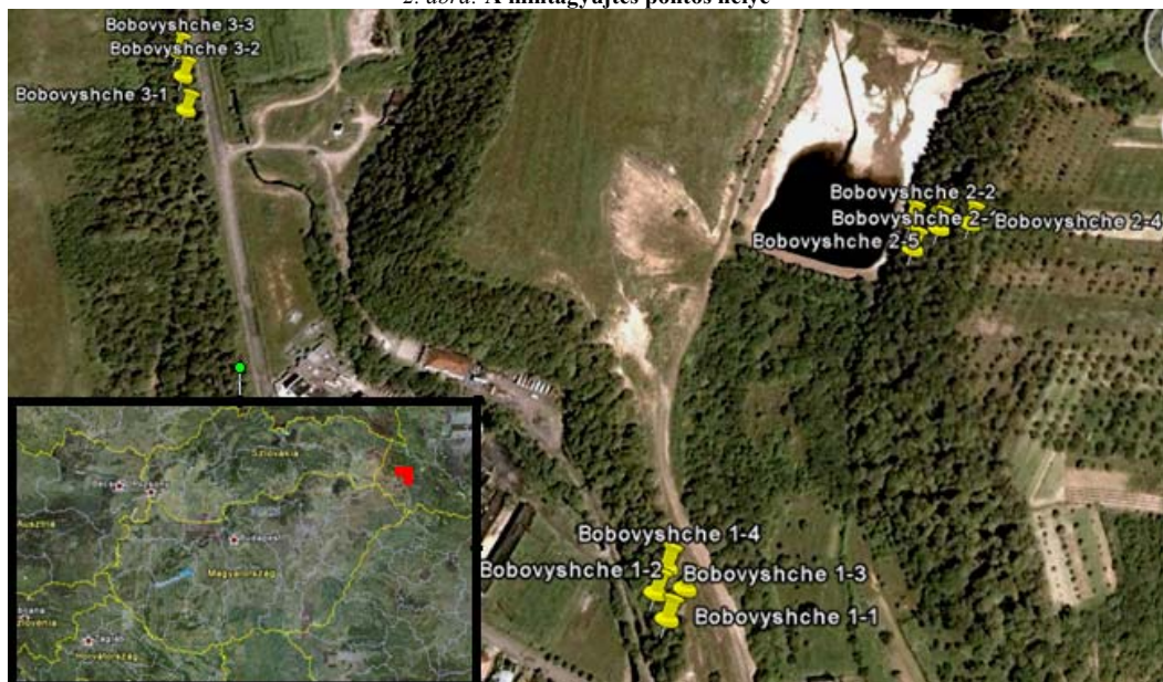
2. ábra: A mintagyűjtés pontos helye