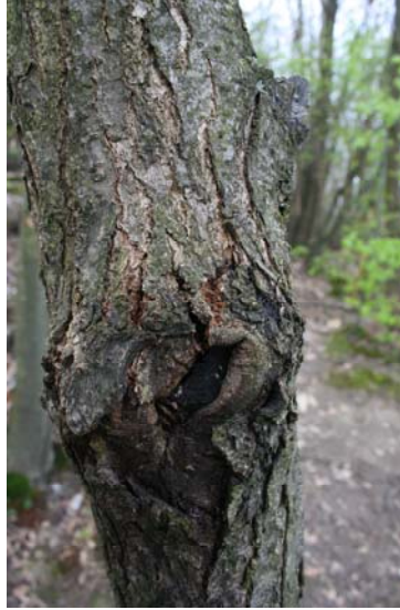
3. ábra: A betegség tünetei a tölgy kérgén