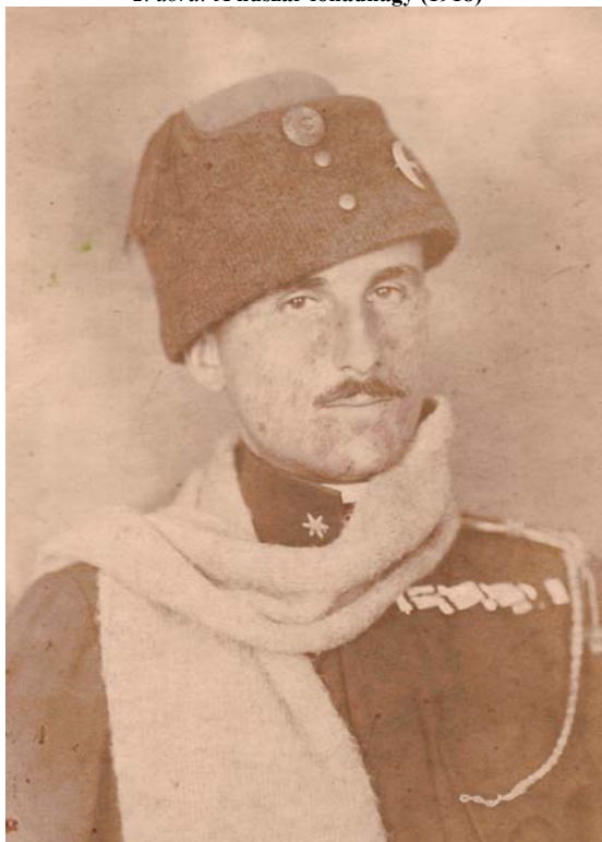
Figure 2: The hussar lieutenant (1918)