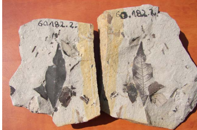
Figure 7: Leaf impression of a dicotyledonous plant (Lipthay collection, Ipolytarnóc)