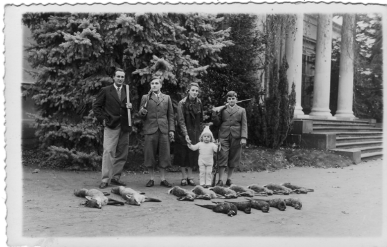
Figure 9. Family hunting (Lovrin, around 1936)