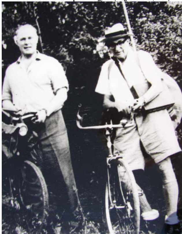
Figure 6: On the way to the Paris valley (Nógrádszakál, 1957)