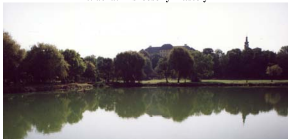
4. ábra: A szécsényi kastély