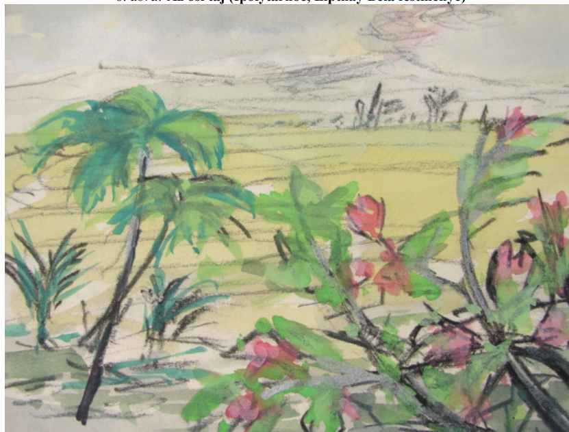
Figure 8: The primaeval landscape (Ipolytarnóc, painting of Béla Liphay)