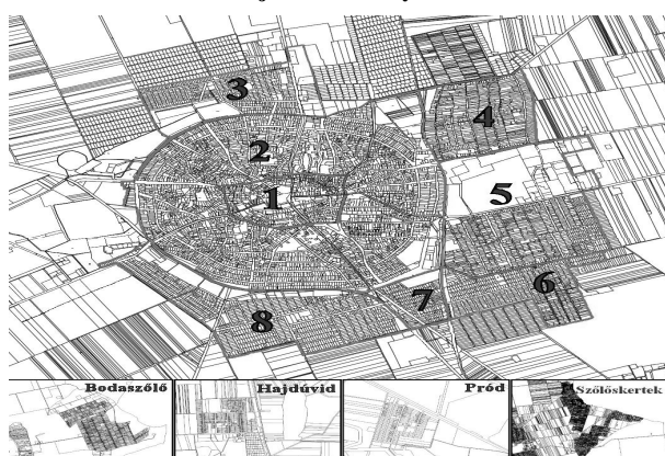
3. ábra: Hajdúböszörmény városrészei

Jelmagyarázat: Városrészek (piros számmal és határral jelölve): 1. Belváros; 2. Kiskörúton kívül eső terület; 3. Északi-Lucernás; 4. Vénkert; 5. Középkert; 6. Zaboskert; 7. Kis-Böszörmény; 8. Déli-Lucernás (továbbá a városközponttól elkülönült három belterület és a legjelentősebb külterületi lakott hely, a szőlőskertek).