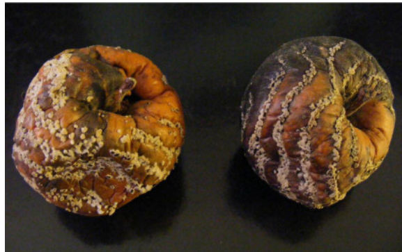
Figure 1: Concentrical exogen stromas on the surface of the fruit caused by Monilinia fructigena

1. ábra: Monilinia fructigena által előidézett gyümölcsrothadás során a felszínen koncentrikusan megjelenő exogén sztrómák