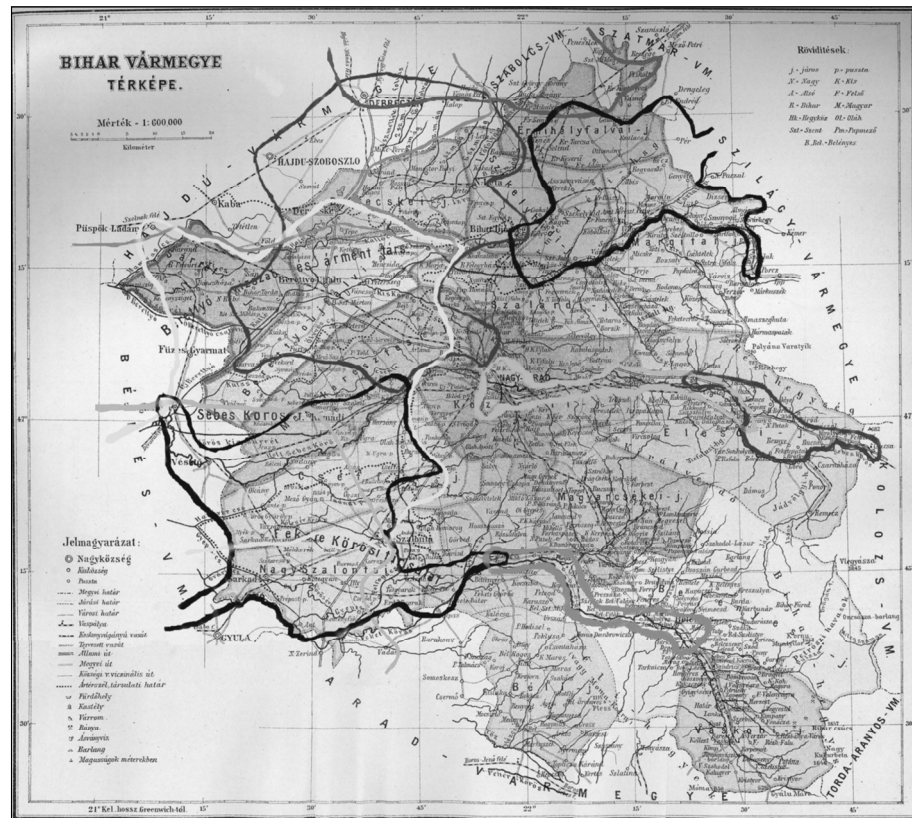
2. ábra: Bihar vármegye kulturális kistérségei – Borsos Balázs 2011-ben megjelent műve alapján – a Magyar Néprajzi Atlaszok tükrében

zíti ebben a térségben az egyértelmű kistérségi besorolást, így tehát az alföldön már erősen kérdéses, hogy mely településeken éppen melyik kötődés lehetett a meghatározóbb, illetve hogy melyek hatnak mind a mai napig, és hogy melyek vannak kiveszőben a köztudatból (2. ábra).