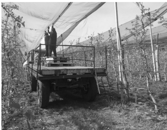
Figure 2: T-25 tractor with special modified trailer when closing hail protection net