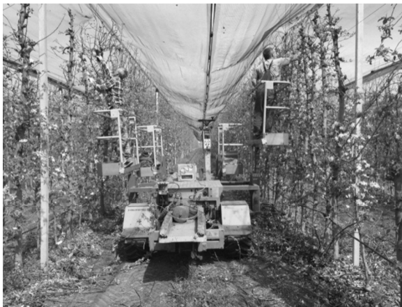
Figure 1: Pruning with "Hermes" work platform

Az utóbbi években már Magyarországra is bekerült néhány ilyen gép. Az önjáró munkaállványok hazai alkalmazásának gazdaságossága azonban jelenleg is eléggé vitatott, mert nálunk jóval alacsonyabbak a munkabérek, amit a gép részben kivált. Gazdaságossági számítások a magyarországi viszonyokra a hazai szakirodalmakban eddig még nem állnak rendelkezésre, ezért tanulmányom fő célkitűzése annak megítélése, hogy az önjáró munkaállványok alkalmazása hazai viszonyok között gazdaságos-e. E fő célkitűzés megvalósításához az alábbi részletes célkitűzéseket határoztam meg: