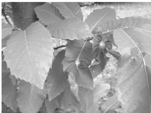
Figure 1: Dryocosmus kuriphilus galls on chestnut leaves (Pécsbánya, 2015)