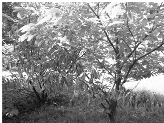
Figure 2: Dead and healthy branches (Pécsbánya, 2015)

A Castanea crenata és C. mollissima nagyfokú toleranciát mutat a Cryphonectria parasitica gombával szemben. Megfigyelték, hogy az említett két ázsiai fajnál is láthatóak nekrózisok, de a kalluszképződés a mérvadó.