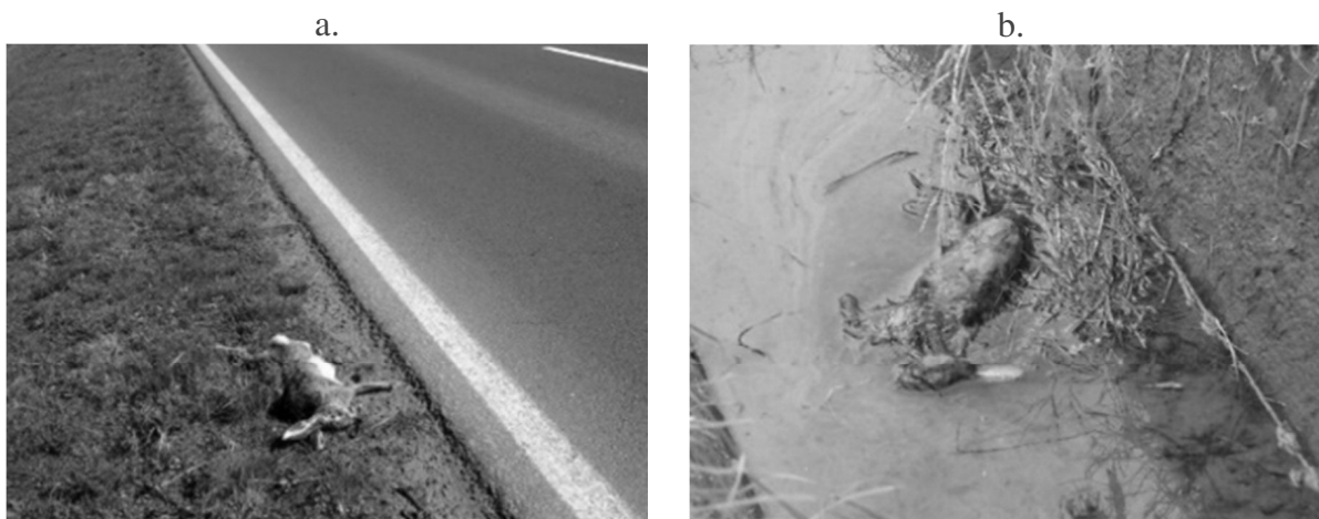
3. kép: Az ember okozta mezei nyúl elhullások (a – vadgázolás, b – mesterséges öntözőcsatornába fulladt példány)

A pillangósok a második, harmadik fialás gyakori helyszínei, ezért a kaszálások különösen veszélyeztetik a fiatal mezei nyulakat (Farkas 1977). A vadriasztás a mezei nyúl esetében a szaporulathoz nem jöhet szóba, de ha a kaszálás a tábla közepétől spirálvonalban kifelé halad a nagyobb nyúlfiókák megmaradhatnak. A mezőgazdaság vadvilágra gyakorolt indirekt hatása közé tartozik a kemikáliák felhasználása. Nikodémusz (1978) id. Biró et al. (2013) megemlíti, hogy a helyesen alkalmazott redentin nem ártalmas a mezei nyúlra. Edwards et al. (2000) vizsgálataiban a korábban paraquat hatóanyagú gyomirtó-szereknek tulajdonított nyulpusztulás okát sem Franciaországban, sem az Egyesült Királyságban nem sikerült igazolni.