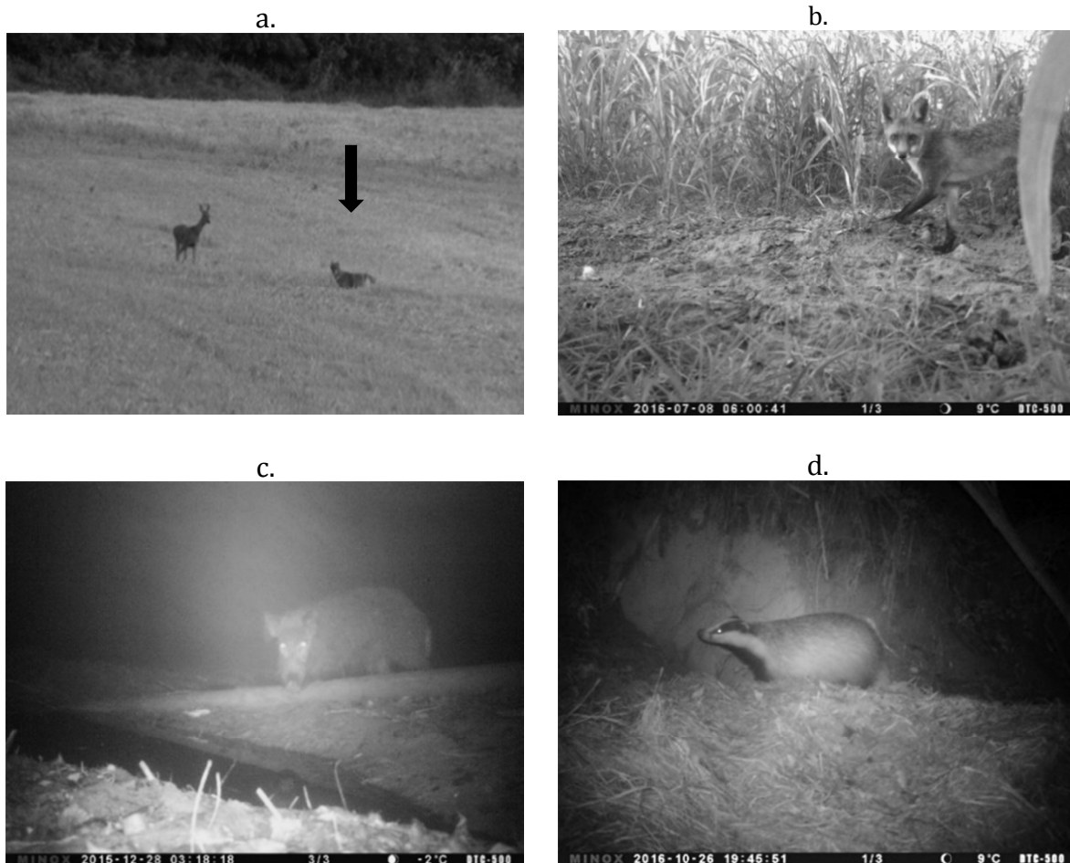
2. kép: A mezei nyúl néhány emlős predátora (a – aranyakál, b – vörös róka, c – vaddisznó, d – eurázsiai borz)