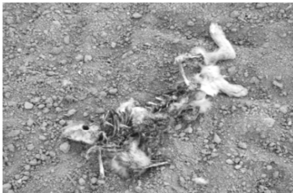
1. kép: Mezei nyúl a ragadozók táplálékmaradványaiban

ján lehetséges (Debrot et al. 1982, Ujhelyi 1989). A köpetmaradványok szétbontására Schmidt (1967) száraz technológiát alkalmaz. A prédaállat szörképletek alapján fénymikroszkópos vizsgálatot követően jól beazonosítható (Görner és Hackenthal 1987) és (Apáthy 2003). Lanszki (2002) a szőrminták meleg zselatinban történő fixálás után 400-szoros nagyításban vizsgálja a fedőszőrök kutikula mintázatát és a szőrök keresztmetszetét. Az ürületek vizsgálatára során a friss minták alkalmasak, amelyek alakja, mérete és szaga alapján nagy valószínűséggel beazonosítható a ragadozó faj. A be nem azonosítható mintákat a vizsgálatból ki kell zárni. Néhány ragadozó faj esetében (például vidra) a friss mintákon a bélhámsejtek DNS vizsgálatával elkülöníthető a préda és a predátor faji hovatartozása. A minták helyszíni alkoholos fixálását követően a mélyhűtés ajánlott a vizsgálatok elvégzéséig. A predátor terítékre hozása esetén lehetőség nyílik gyomortartalom vizsgálatokra (Szócs et al. 2006).