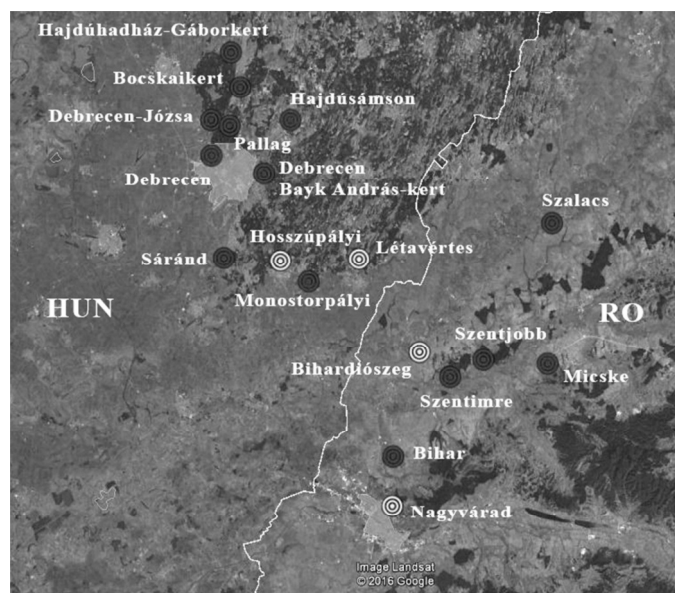
4. ábra: A Scaphoideus titanus vizsgálata során 2014–2016-ban a hazai Hajdú-Bihar és a romániai Bihar megye területén mintázott települések (n=18)

Megjegyzés: a kabóca jelenléte – kimutatható (fekete pontok), – nem mutatható ki (fehér pontok), Forrás: GoogleEarth (2016)