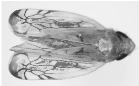
Figure 1: Scaphoideus titanus collected by yellow sticky trap (Debrecen-Pallag, 2016)

A kabóca elterjedésének vizsgálatát 2015-ben Nagyvárád, 2016-ban Debrecen környéki területeken végeztük el. 2015-ben hét romániai település (Bihar, Bihardiószeg, Micske, Nagyvárád, Szalacs, Szentimre, Szentjobb) területén zajlottak vizsgálatok részben hálózással, részben sárga ragacs-lapok kihelyezésével. Szentjobbon, Szentimrén és Szalacson egyaránt két-két mintaterületet vizsgáltunk, így a romániai mintavételi helyek száma összesen 10 volt. 2016-ban Hajdú-Bihar megyében hat területen (Bocskai kert, Debrecen-Pallag, Debrecen-Bayk András kert, Debrecen-Józsa, Hajdúsámson, Debrecen (DE Bemutatókert, Bősör-ményi út) végeztünk csapdázást, ám Hajdúsámsonban két közeli mintavételi terület is kijelölésre került, így a magyarországi mintavételi helyek száma összesen hét volt (2. ábra, 1. táblázat).