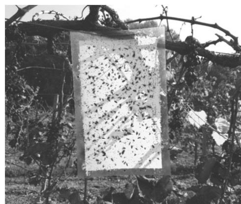
Figure 3: CSALOMON® yellow sticky trap in the garden of University of Debrecen (Debrecen, 2016)