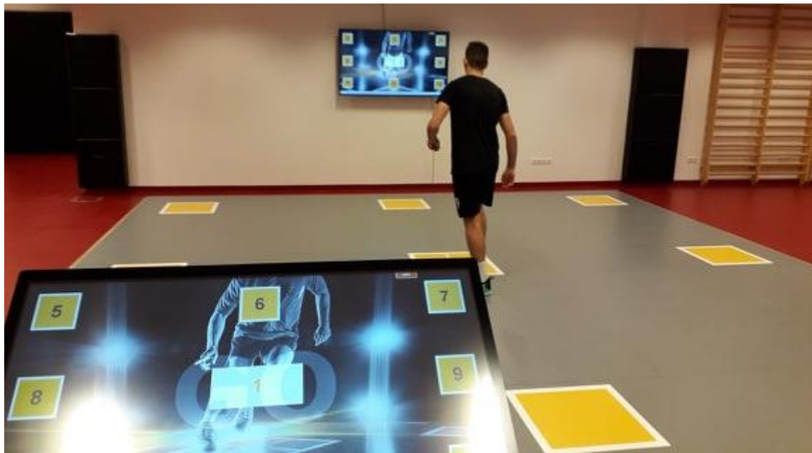
2. ábra: A Speed Court berendezés mérés közben

A felmérés a '60 méteres kergetés', valamint a '30 másodperces kergetés' elnevezésű tesztekből állt. A tesztek a Sportdiagnosztikai Életmód és Terápiás Központ (SETcenter) munkatársai egyéni beállítások alapján állították össze. A vizsgálatban résztvevő sportolók a tesztfeladatokat Speed Court 550 Q12 típusú berendezésen (2. ábra) hajtották végre. A teszt lényege, hogy a sportolók, egy adott számítógép által vezérelt jelre indulva, előre beállított útvonalon haladva, minél gyorsabban érintsék a 3×3-as alakzatban elhelyezett csomópontokat. A résztvevők a futófelülettel szemben elhelyezett digitális kijelzőn kapták az utasítást, hogy mely számkóddal jelölt csomópontoz kell továbbhaladniuk, s legalább egy lábbal érinteniük. Valamennyi sportoló három kísérletet hajtott végre egy perces pihenővel. A Speed Court pálya 5.5 m 2 -es alapterülete, kutatási céljaink szempontjából, a vizsgált sportmozgások dinamikáját tekintve tökéletesen megfelelő volt.