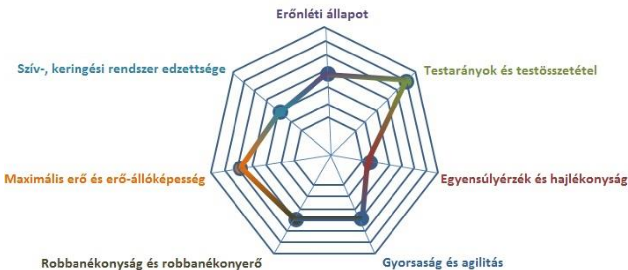
1. ábra: Kondicionális állapot kiértékelése pókdiagram formájában

Rengeteg innovatív módszer látott napvilágot az utóbbi évtizedekben, mely sportolók fizikális vagy épp mentális teljesítményét hívatott vizsgálni (BORG – KAIJSER, 2006; JOYCE - LEWINDON, 2014; McGUIGAN et al., 2013; PESCATELLO et al., 2014; PETRIDIS, 2015). Ezek az eljárások inkább specifikusabbá váltak, s egy adott teljesítmény-összetevőre koncentrálnak (BURNSTEIN et al., 2011; CASTRO-PIÑERO et al., 2010; GABBETT-SHEPPARD, 2013; TOMKINSON et al., 2018; TABACCHI et al., 2019). Léteznek persze eljárások, melyek megpróbálják ezeket az önálló összetevőket kapcsolatba hozni egymással, így például Fakuda (2019) módszerét követve egy komplex teljesítményprofil készíthetünk sportolónkról. A korábbi publikációk normatív adataival összevetve, majd egy pókdiagramon ábrázolva (1. ábra) visszacsatolást adhatunk sportolóinknak fizikális állapotukat illetően. Ennek segítségével jól érzékeltetjük a fejlesztendő területeket, mely a szintén feltüntetett erősségekkel közösen motiválóan hathat versenyzőnkre. Ráadásul a pókdiagramon való szemléltetést csapatsportolók esetében akár egymáshoz viszonyítva is megtehetjük, kijelölve ezzel az egyéni fejlesztés irányvonalait. Ez a személyre szabott kondicionális és koordinációs képesség fejlesztést is elősegíti, csapatsportot űzők esetében is (HOARE, 2000; GABBETT et al., 2008; IMPELLIZZERI et al., 2005; MIGUEL, 2021; McLEAN et al., 2010; NOBARI et al., 2021)