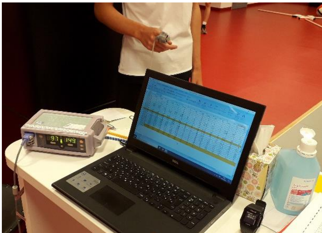
3. ábra: Pulzuszám meghatározása oximéterrel

A sportolók testösszetételét a bioelektromos impedancia elvén működő Tanita Pro BC-1000 készülékből nyert adatokból, illetve mérőszalaggal vett magasságbecslésből származtattam. A komputer két adatot rögzít, a BMI értéket és a testzsír-százalékot, melyeket négy-négy kategóriával jellemez. A BMI mutatónál elkülönít 1) túlságosan alacsony testsúly; 2) jó tartomány; 3) túlsúlyos; 4) adipositas kategóriába tartozó vizsgálati személyeket, míg a testzsír-százalék esetében 1) alacsony; 2) jó; 3) magas és 4) adipositas csoportokba sorolja a résztvevőket. Mivel a sportolók jelentős része mindkét testösszetétel mutatóban (BMI, testzsír-százalék) a 'jó' tartományba esett, így a 'jó' tartományt a számtani középértékénél 'jó-' és 'jó+' értékekre bontottam érzékeltetve ezzel az árnylatnyi különbségeket. Ennek értelmében 'jó' tartományba sorolt sportolók közül a magasabb testtömeggel és testzsír-százalékkal rendelkezők 'jó+', míg az alacsonyabb testtömeggel és testzsír-százalékkal rendelkezők 'jó-' besorolást kaptak.