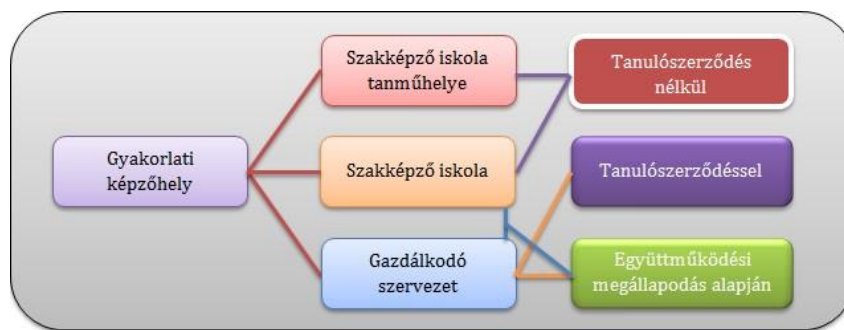
2. ábra: Részvétel a gyakorlati oktatásban

Az iskolai rendszerű szakképzésben részt vevő tanulóknak az elméleti oktatás mellett gyakorlati képzésben is részt kell vennie. A szakmunkástanulók gyakorlati képzésére – ahogyan azt a bevezetésben is említettem – több lehetőség is van. Fontos elkülöníteni az iskolában és/vagy az iskolai tanműhelyben, illetve a gazdálkodó szervezetnél folyó gyakorlati képzést. Ezzel szoros kapcsolatban áll az is, hogy tanulószertződésel vagy tanulószertződés nélkül vesz részt a tanuló a gyakorlati oktatásban.