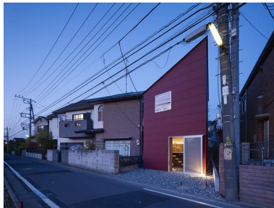
2. ábra Suppose Desing: House in Seya, Kanaga

A befejezettség definiálása tehát nemcsak a szó értelmezéséből ered, hanem a döntésből, hogy valami mikor válik számunkra befejezetté. Egy festmény esetében sem tudjuk eldönteni, hogy a művész valóban így akarta az utókor elé tárni művét. Tehát arra következtetésre juthatunk, hogy a befejezettség onnantól válik definiálhatóvá, ha mi magunk nyilvánítjuk azzá.